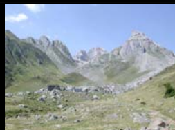
SERVICES RENDUS PAR LES ECOSYSTEMES MONTAGNARDS - UICN France - 8 AVRIL 2014