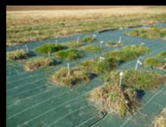
SELECTION DE SEMENCES FOURRAGERES GIS 64 - 06 FEVRIER 2014