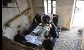
REUNION DE CHANTIER ASPOROTTSIPPI - HENDAYE - 4 FEVRIER 2014