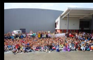
JOURNEE FINALE DE RESTITUTION ECO PARLEMENT DE JEUNES ORTHEZ - 06 JUIN 2014