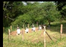
INSTALLATION D'UN RUCHER ECOLE ASS. NATURE ABEILLE CAMBO LES BAINS - MARS 2014