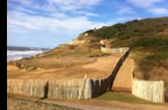
INSTALLATION DE GANIVELLES ERRETEGIA BIDART BTS « GPN », ST PALAIS