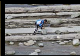
SUIVI DES EFFETS DE LA PECHE A PIEDS SUR L'ESTRAN CPIE LITTORAL ET IMA