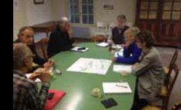
PARKING DE BIOUS ARTIGUES COM. SYND. BIELLE-BILHERE EN OSSAU - 3 JUIN 2014