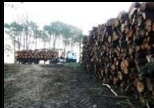
EXPLOITATION FORESTIERE LAZARET - ANGLLET - 05 MARS 2014