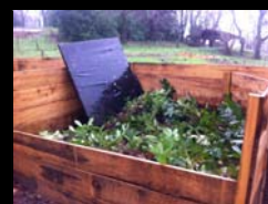
DIAGNOSTIC DES FILIERES D'ELIMINATION DES ESPECES EXOTIQUES ENVAHISSANTES - 22 AVRIL 2014