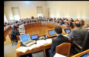
ADOPTION DU NOUVEAU PLAN D'ACTIONS DES ESPACES NATURELS SENSIBLES 2014 - 2017 - 10 AVRIL 2014