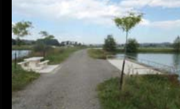
AMENAGEMENT DE « COINS PECHE » FED PECHE 64 - JUIN 2014