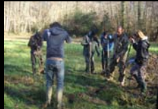
CHANTIER ECOLE AVEC CLASSE DE BTS « GPN », ST PEE HABAS - BAYONNE - FEVRIER 2014