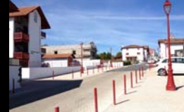
SOUTIEN A L'AMENAGEMENT DES ESPACES PUBLICS (Ex : URRUGNE) - MAI 2014