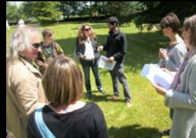
FORMATION DES ENSEIGNANTS SUR L'HISTOIRE DES JARDINS - LAAS - 14 MAI 2014