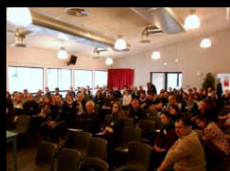
ANIMATION DU COLLOQUE G.I.S. ATLANTIC FLYWAY NETWORK - BAYONNE - 31 JANVIER 2014