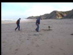
SUIVI DU TRAIT DE COTE PAR DRONE GIP LITTORAL - 09 JANVIER 2014