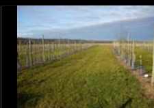
ENTRETIEN DU VERGER DE LAAS - ESTIVADE D'ASPE - 18 JUIN 2014