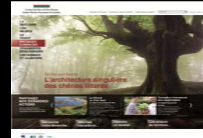
SITE INTERNET PATRIMOINE NATUREL DU PAYS BASQUE. CONSEIL DES ELUS DU PAYS BASQUE - 12 FEVRIER 2014