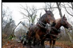
DEBARDAGE A CHEVAL BASTARD PAU ONF - 23 JANVIER 2014