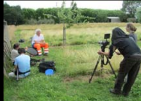
SORTIE D'UN FILM SUR LES SEMENCES PYRENEENNES - MAI 2014