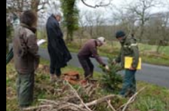
FIN DU CHANTIER DE PLANTATION ARBORETUM DE PAYSSAS - LASSEUBE - FEVRIER 2014