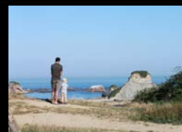
SCHEMA DEPARTEMENTAL DU TOURISME ET BIODIVERSITE - 28 AVRIL 2014