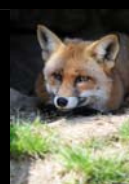
CARTOGRAPHIE DES ESPECES ANIMALES « NUISIBLES » SUR LE DEPARTEMENT - 7 AVRIL 2014