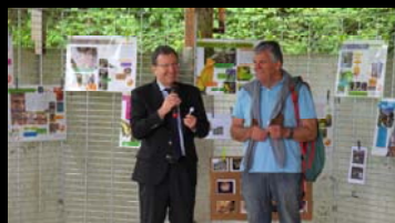
FETE DE LA NATURE CAMBO LES BAINS - 24 MAI 2014