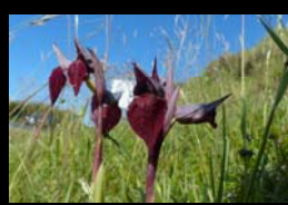
POURSUITE DE LA CONNAISSANCE FLORISTIQUE DU DEPARTEMENT CBN SA - 12 AVRIL 2014