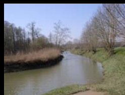
PLAN DE GESTION DES BARTHES DE L'ARDANAVY URCUIT