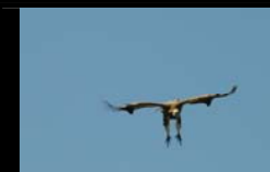
CONDITIONS DE MISE EN ŒUVRE D'UNE PLACETTE EXPERIMENTALE DE NOURISSAGE DES VATOURS FAUVES - SAIAAK