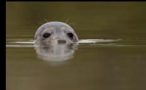
CARTOGRAPHIE DES HABITATS EN MER NATURA 2000 MER URRUGNE - 27 JUIN 2014