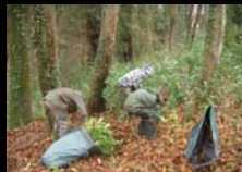
ARRACHAGE MANUEL DES LAURIERS LYC. AGRI. ST PEE - CAMBO - 28 JANVIER 2014