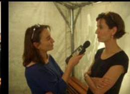
PRESENTATION DE « NATURE 64 » AU CG DE L'INDRE - CHAILLAC - 06 JUIN 2014