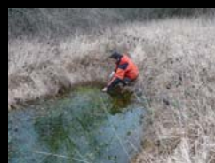
INVENTAIRE DES MARES DU DEPARTEMENT CAT ZH 64