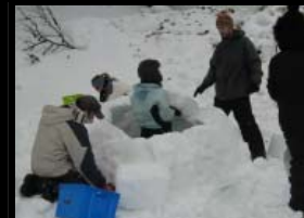
L'ENS DU MOIS CPIE BEARN - BRACA ARETTE - 8 FEVRIER 2014