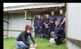
FORMATION DES POMPIERS A LA MANIPULATION DE LA FAUNE SAUVAGE CENTRE DE SOINS HEGALALDIA