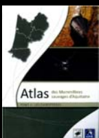
TOME 3 ET 4 ATLAS DES MAMMIFERES D'AQUITAINE - 30 JANVIER 2014