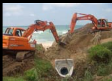
RESTAURATION DU RESEAU PLUVIAL ERRETEGIA BIDART - 02 JUIN 2014