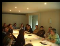
PREMIERE REUNION DEPARTEMENTALE DES GESTIONNAIRES DES ESPACES NATURELS SENSIBLES - BAYONNE - 09 JANVIER 2014