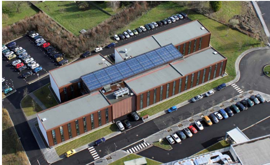
Vue extérieure de l'hôtel d'entreprises

2 600 m 2 de bureaux loués, à ce jour, principalement à des entreprises sous-traitantes de Turboméca (bureaux d'études, prestataire de services...) profitant de la situation privilégiée offerte par le site Aeropolis, de la fibre optique et d'un environnement totalement sécurisé.