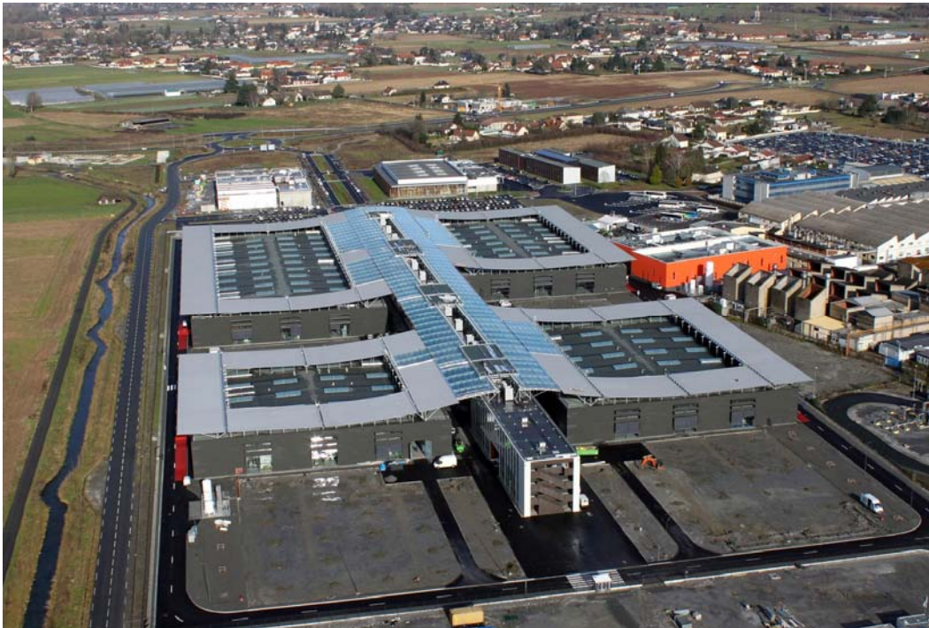
Vue aérienne de la zone sud (hôtel d'entreprises, restaurant inter entreprises au dernier plan, usine Turboméca au premier plan)