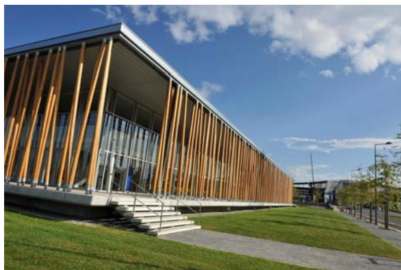
Vue extérieure du restaurant interentreprises