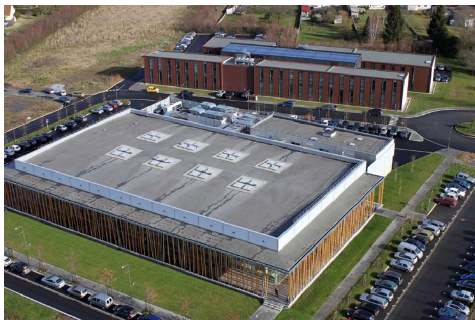
Au premier plan, le restaurant interentreprises