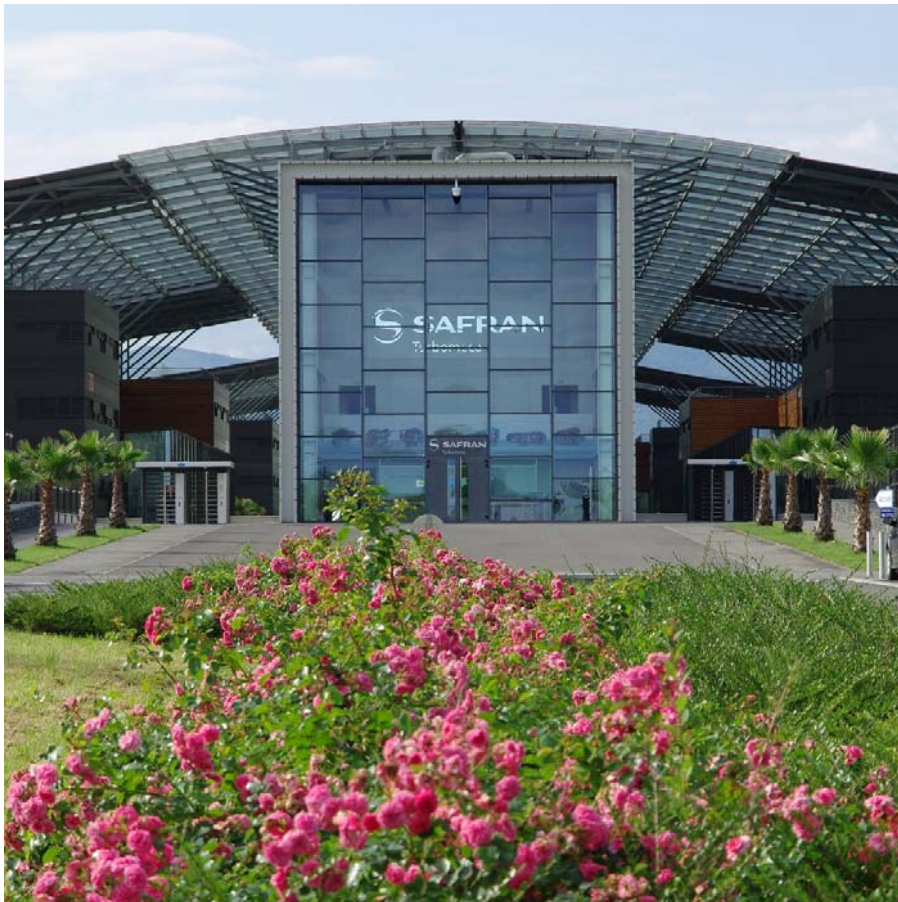
La nouvelle usine Joseph Szydlowski de Turboméca

Aéropolis accueille le siège et le principal site de fabrication de TURBOMECA (groupe SAFRAN), leader mondial dans la conception, la fabrication et le support de turbines pour hélicoptères. Plus de 2500 salariés travaillent sur le site.